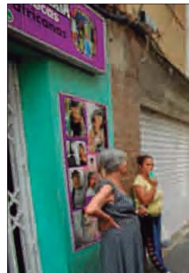
Dos mujeres esperan la llegada de un autobús

Los técnicos realizan estos días «mediciones y marcajes» sobre determinadas aceras para indicar dónde deben colocarse las señales (en banderola o en prisma, según la terminología de Vectalia) con las nuevas paradas. Según estos expertos, durante esta semana concluirán estas labores, a las seguirá la elaboración de estudios especifi-