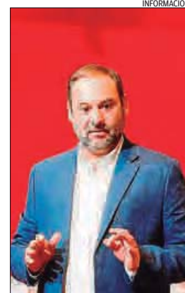
El ministro José Luis Ábalos.

«Lo lógico es que asuma la gestión la administración más próxima al territorio donde está problema», abundó en su argumentación.