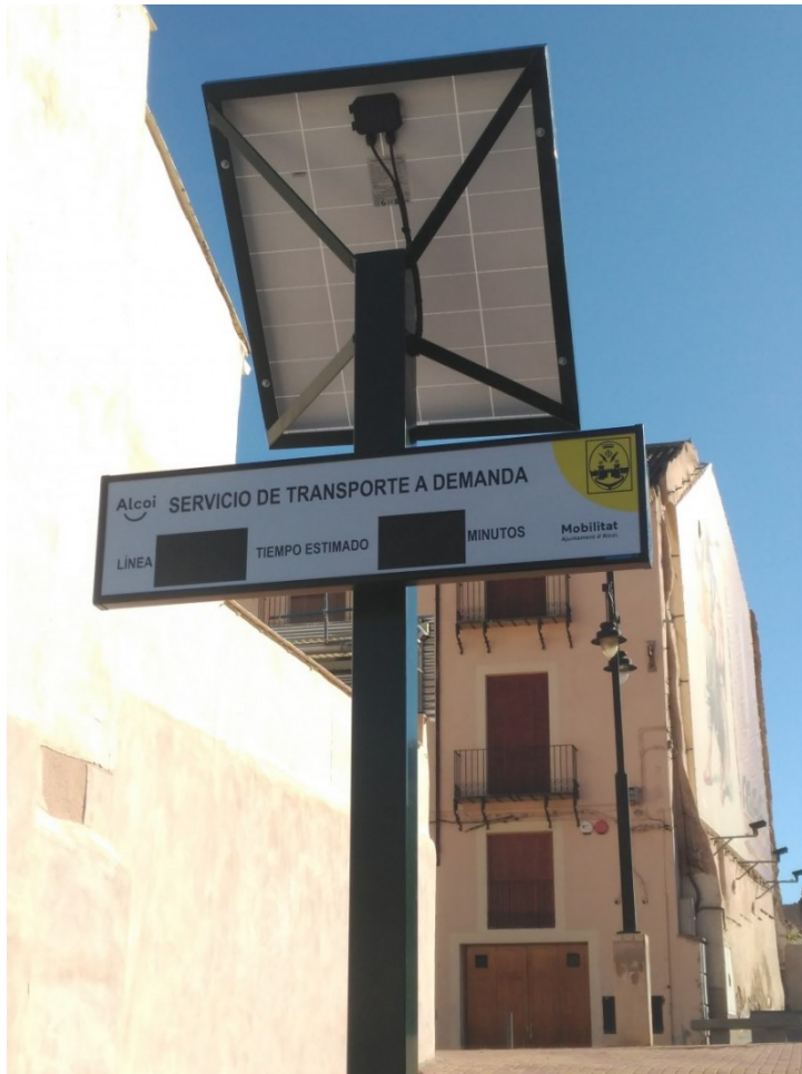
Una de les tres parades, ubicades al carrer Verge Maria

En finalitzar el termini de proves està previst concretar reunions amb els veïns dels barris afectats amb la intenció d'explicar-los el funcionament del nou servei.