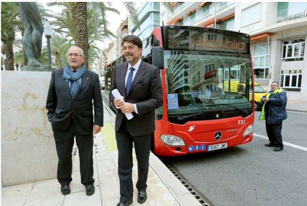
El alcalde y Concejala de transportes frente al bus (Ayuntamiento)

Más de 47 mil viajeros utilizan diariamente las líneas de Masatusa del Ayuntamiento para desplazarse en Alicante