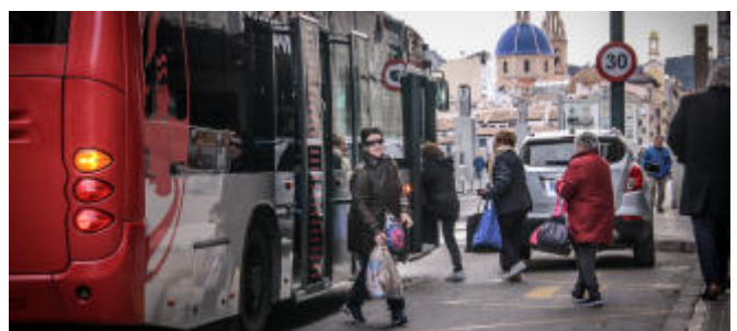
El número de viajeros del autobús sigue creciendo JUANI RUZ

Los datos de viajeros del servicio de autobús urbano de Alcoy continúan sumando y, otro mes, han aumentado. Respecto al mismo mes del año pasado, las cifras se sitúan en un 12,99% más . En abril de 2019 el autobús urbano ha tenido un total de 142.697 viajeros, mientras que en el mismo mes de 2018 tuvo 126.291. Desde el Ayuntamiento se destacan dos aspectos, que este año las Fiestas de Moros y Cristianos , que suponen un gran número de usuarios con el autobús lanzadera y los desplazamientos al centro han sido en mayo, por lo que todavía podría haber tenido mejores cifras. Además, cabe resaltar que hay que remontarse a 2008 para tener unas cifras mejores en el abril.