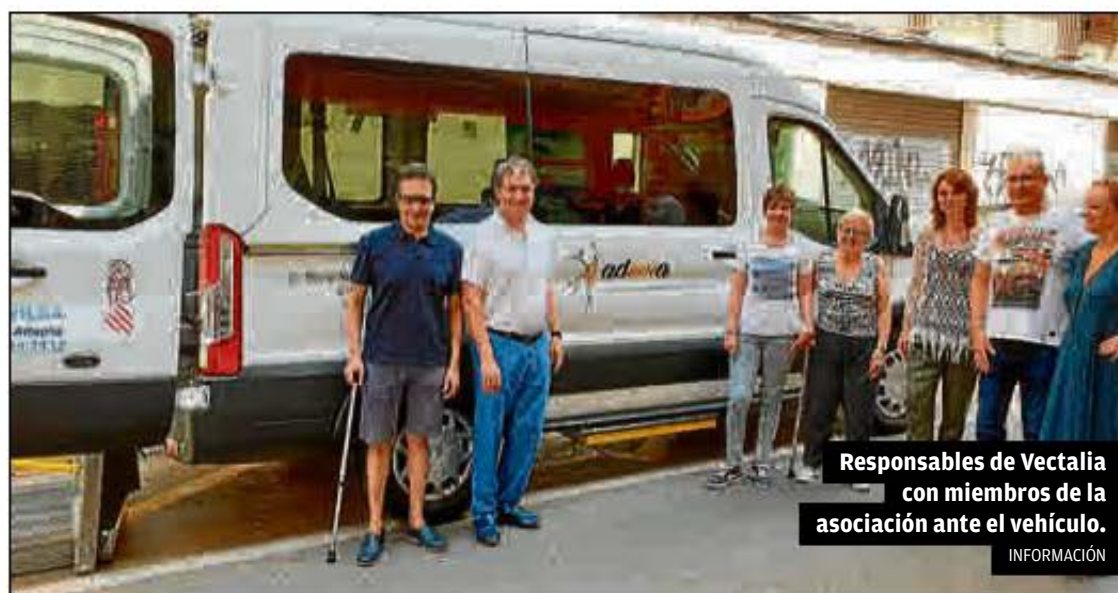
Responsables de Vectalia con miembros de la asociación ante el vehículo.