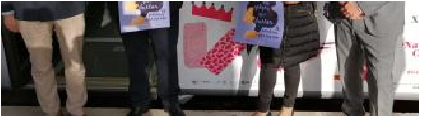
Un momento de la presentación de los carteles esta mañana INFORMACIÓN