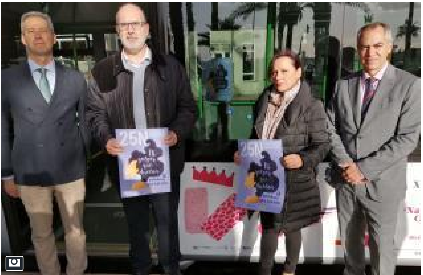
150 autobuses se suman a la campaña por la eliminación de la violencia machista